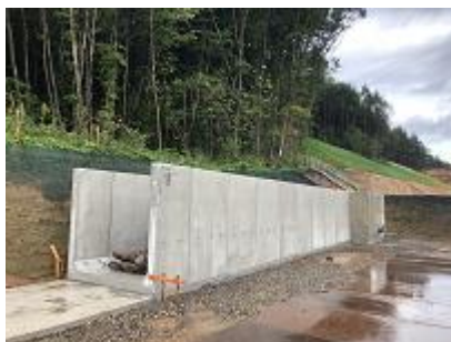
花沢の付替水路施工状況 （施工中）