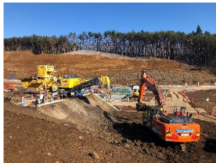
造成土の改良状況 （施工中）