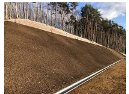
植生基材吹付状況 （施工完了）