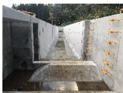
花沢の付替水路施工状況 （施工中）